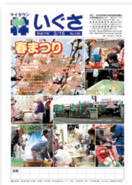
第185号(2005年) 徐々にカラー印刷に